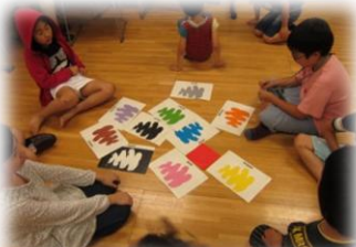
火・木曜日 イングリッシュ