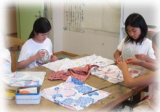
火・水曜日 ものづくり