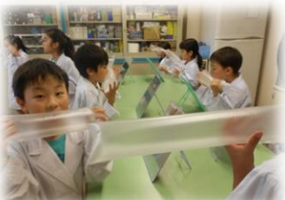
水曜日 サイエンス