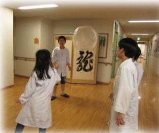
水曜日 サイエンス