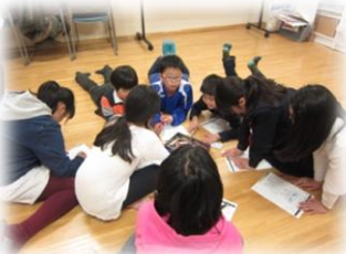
火・木曜日 イングリッシュ