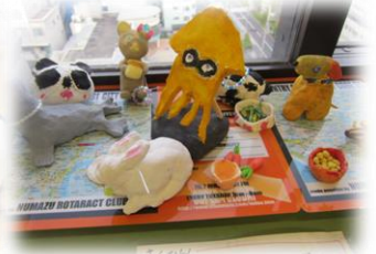
火・水曜日 ものづくり