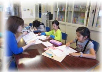
金・土曜日 マンガ教室

※未体験のプログラムについては無料で体験ができます。スタッフまでお問い合わせください。