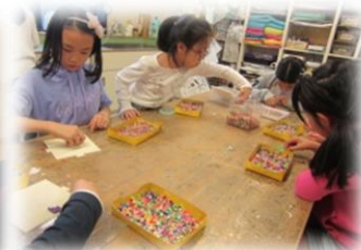
火・水曜日 ものづくり