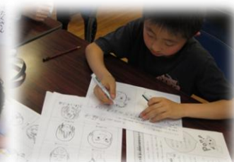
金・土曜日 マンガ教室

※未体験のプログラムについては無料で体験ができます。スタッフまでお問合わせください。