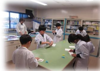
水曜日 サイエンス