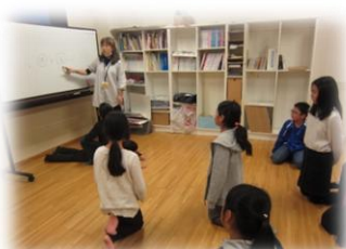
火・木曜日イングリッシュ